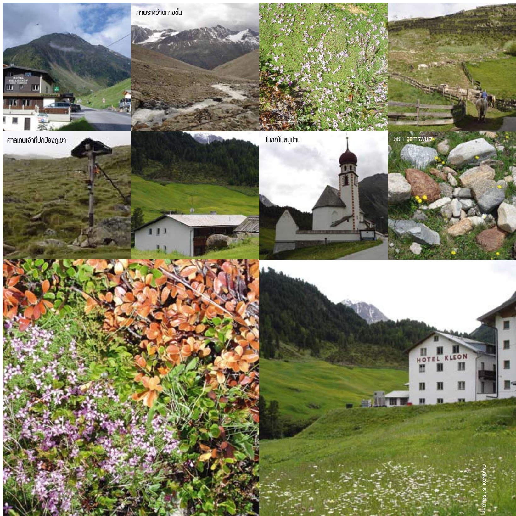
ภาพระหว่างทางขึ้น